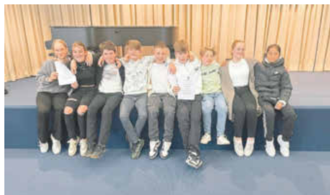
Die Libo-Schüler waren erfolgreich beim Wettbewerb.