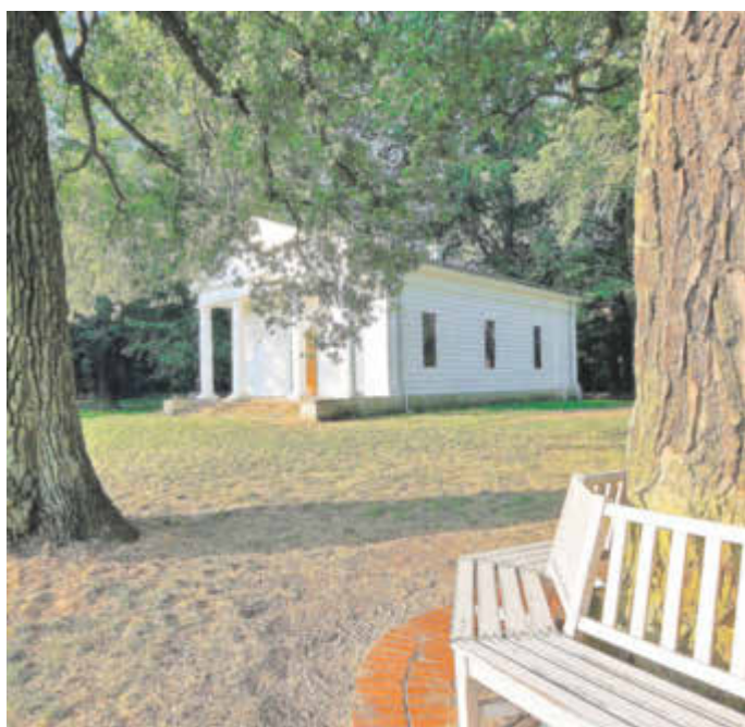
Die Solitüde im Sieglitzer Park.